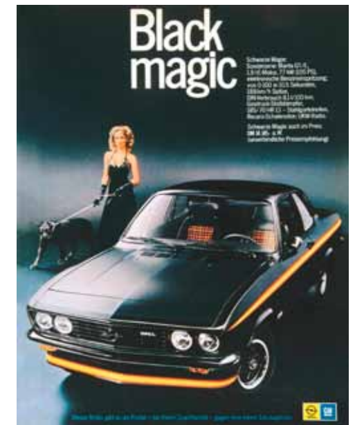
Strax före lanseringen av Manta B dök Black Magic upp. Idag skapas replikor av denna specialversion.

Opels första lilla "muskelbil" blev en framgång, totalt tillverkades 498 553 Manta A fram till och med 1975 när Manta B tog över. Med drag från Corvette, Camaro och Fiat Dino är första generationen Opel Manta idag en allmer eftertraktad samlarbil. Ibland skymd av efterträdaren