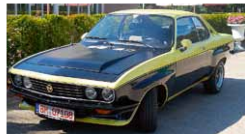
Bara 79 Manta TE2800 byggdes av belgiska Transurope Engineering i 1974–1975. 2,8-literssexan hämtades från Commodore och gav 142 hk i "standardversionen".