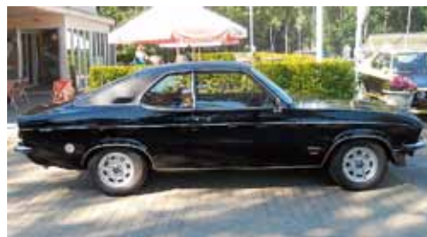
Snabba Turbo Manta med 158 hk var resultatet av ett samarbete mellan Opel D.O.T. och brittiska Broadspeed och gick endast att köpa i Storbritannien. 28 byggdes.