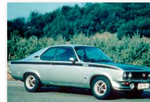
Manta GT/E med insprutningsmotor och 105 hk introducerades i mars 1974 men kom aldrig till Sverige. Här fick vi nöja oss med 1600-motorn de sista åren.

Förutom emblemet på bakluckan utmärks SR-versionen av 1900-emblem på sidorna samt dubbla utblås bak. Den starkare 1,9-litersmotorn matchas av en högre utväxlad bakaxel. CIH-motorn debuterade i Rekord B 1966 och levde ända fram till 1993. CIH kan utläsas "cam in head" och detta var Opels första motor med överliggande kamaxel, ursprungligen konstruerad i USA. God trimpotential hjälpte till att starta en ny era för Opel i motorsportsammanhang med otaliga segrar under 1970- och 80-talen.