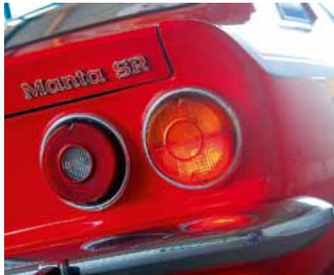
Runda bakljus anknar till Opel GT och Chevrolet Corvette.